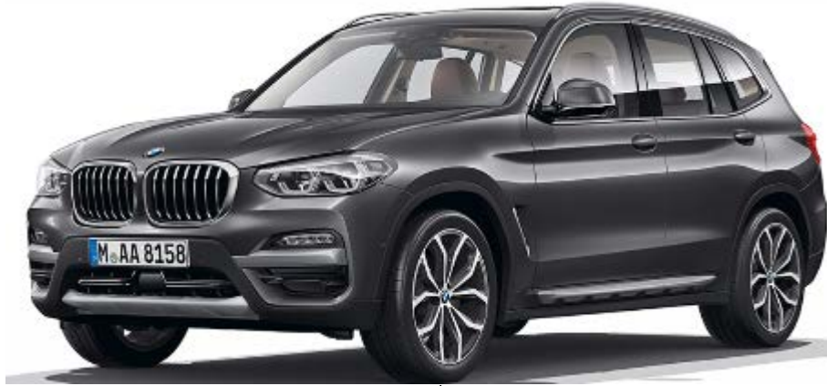
写真は左ハンドル車