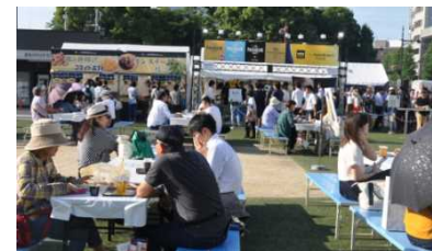
暫定供用中の(仮称)花畑広場における活用事例①