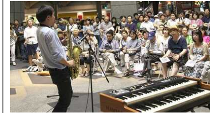
中心商店街地区魅力向上事業 (ストリートアートブレックスの開催)