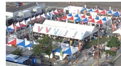
暫定供用中の(仮称)花畑広場における活用事例②