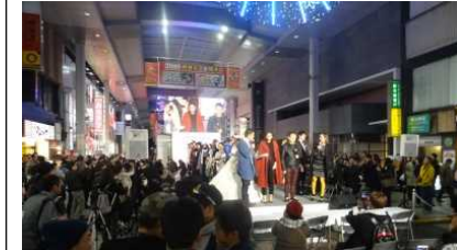
ファッションの街くまもとの魅力創出 (まちなかコレクションの開催)