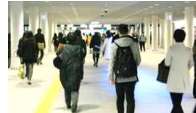
辛島公園地下通路再整備(イメージ)