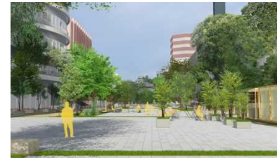
オープンスペース整備(イメージ)