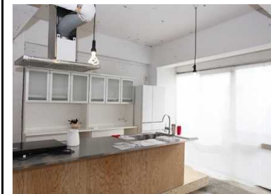
住宅転用促進事業、空洞化対策事業 (空きビル活用:シェアハウス)