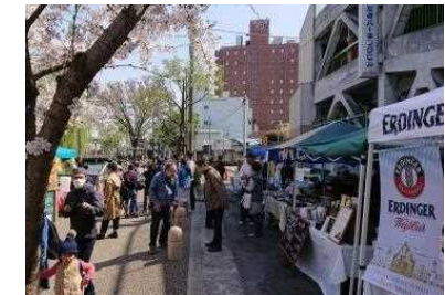
都市再生推進法人の指定 公共空間を活用したオープンカフェやイベントの企画・運営

アーバンデザインの策定 まちづくりの整備方針が共有化(具体化)されることで、官民の役割が明確化され、遊休不動産を活用した「まちのリノベーション」の積極的な取り組みにつなげる