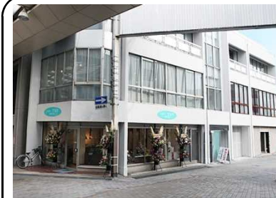
住宅転用促進事業、空洞化対策事業 (空きビル活用:店舗)