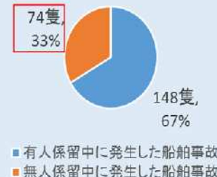
有人・無人別係留中船舶事故発生状況