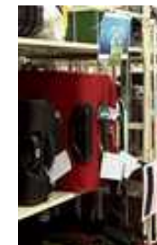
荷物を一時保管 するラック