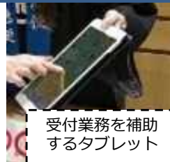
受付業務を補助 するタブレット