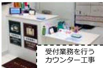
受付業務を行う カウンター工事