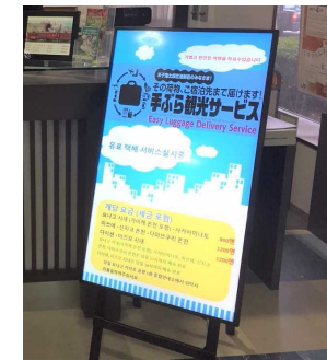
多言語でサービス情報を提供するデジタルサイネージ