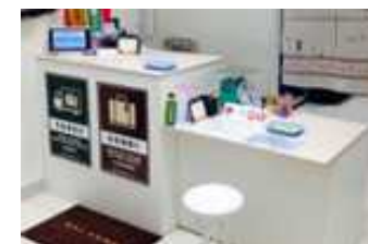
受付業務を行う カウンター設備