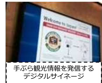
手ぶら観光情報を発信する デジタルサイネージ