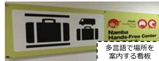
多言語で場所を 案内する看板