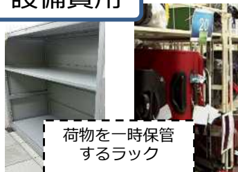
荷物を一時保管 するラック