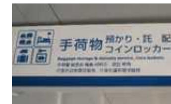
手ぶら観光カウンターの 場所を案内する看板