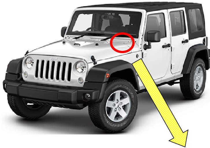
助手席用エアバッグインフレーター