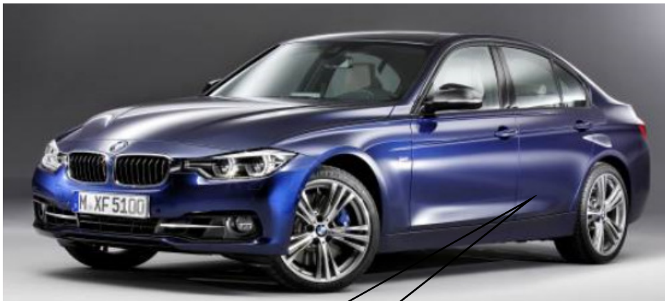
写真は左ハンドル車