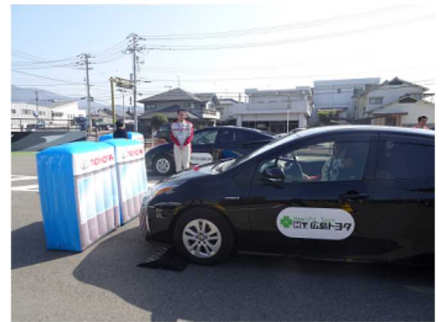
(広島トヨタ自動車株式会社)

今回は、呉市に在住する高齢の方々80名に御参加いただきましたが、みなさん「ひさしぶりに学校という空間にきた」とうれしそうでした。学生たちとふれあうことにより世代交流も実現し、楽しんで体験をしていただけたと思います。