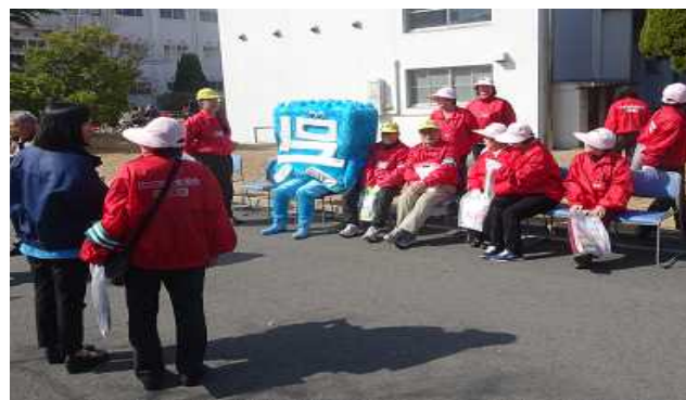
広島県呉市のキャラクター「呉氏」も参加のりたろうは都合により参加できず…

今回の体験会は、サポカー体験は自動車ディーラー3社に、バスの乗り方教室は呉市内を運行しているバス会社に担当していただいたほか、体験会の会場として敷地を開放いただいた呉工業高等専門学校及び地元自治体である呉市や広島県バス協会、広島県警など産学官の多様な主体の連携により、開催が実現しました。関係者それぞれがこれまでに実施してきた体験会等の経験を持ち寄り、会場の提供やプログラム全体の監修、参加者の募集等について協力し合い、産学官それぞれの機関の持ち味を十分活かすことができたイベントとなりました。