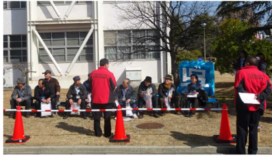
(ダイハツ広島販売株式会社)