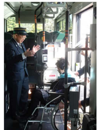
バスの乗り方教室 (広島電鉄株式会社)