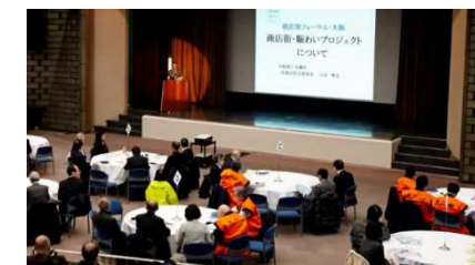
開催イベントの様子