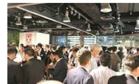
ネットワーキング パーティの様子