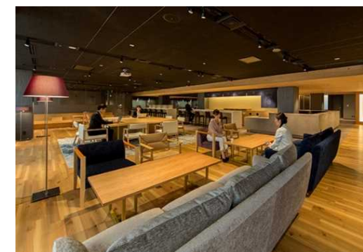
SENQ霞が関の内観(ラウンジ)