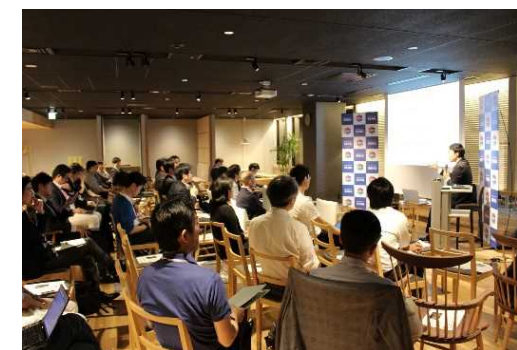
SENQ霞が関で開催されたイベントの様子