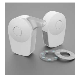
本施設でデザインされた 経肺薬展開デバイス 13