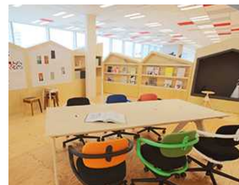
LODGEの内観 (ミーティングスペース)