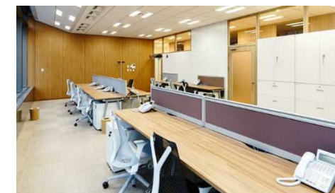
オフィススペース