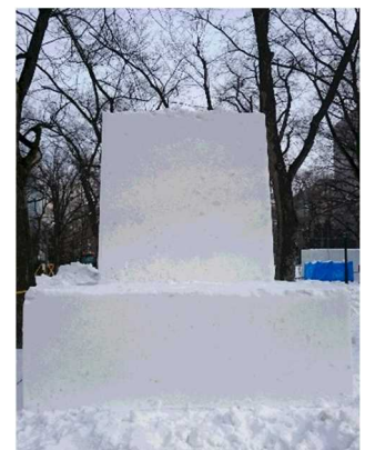
巨大な豆腐のような雪の塊

1月31日(水)からいよいよ雪像制作に取りかかります。高さ3メートルほどの豆腐のような雪の塊から、様々な形に加工していきます。果たして「のりたろう」の姿になるかどうか？！是非会場にてご確認ください。