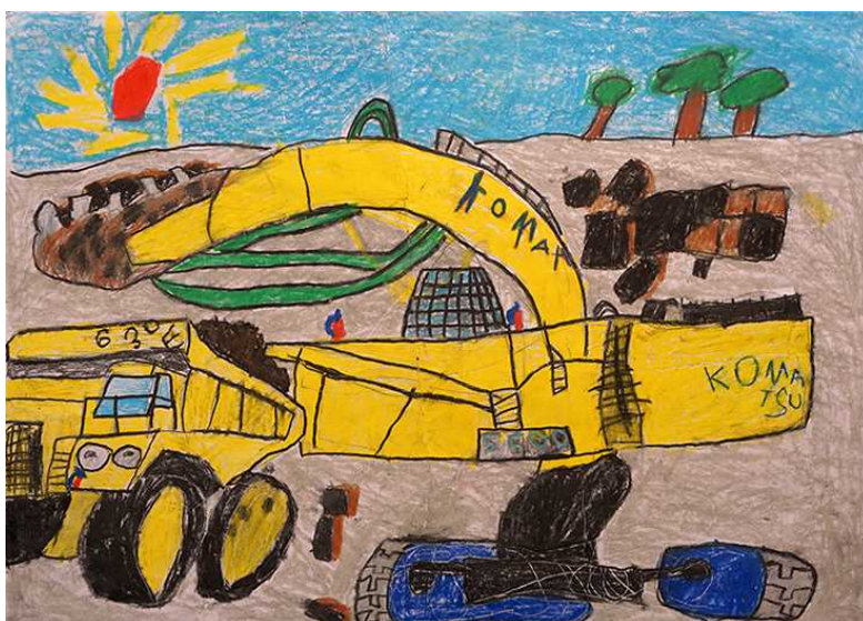
「すごいなショベルカー」

何度も描き直ししながら、納得のいくまでショベルカーの形を考えて完成させた過程が、作品から伝わってきます。すごいショベルカーになりました。