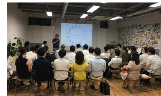
情報交換イベントの様子