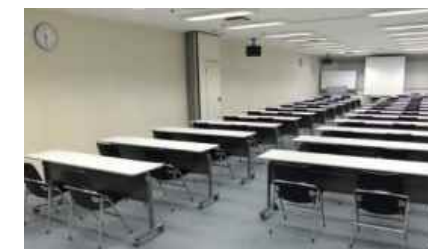
大阪商工会議所の会議室