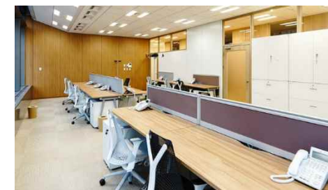
オフィススペース