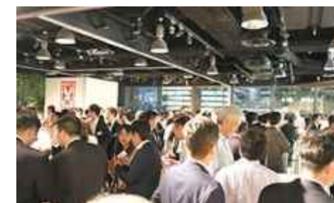
ネットワーキング パーティの様子