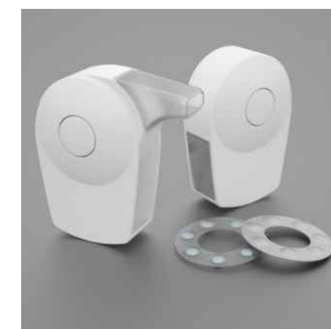
本施設でデザインされた 経肺薬展開デバイス 10