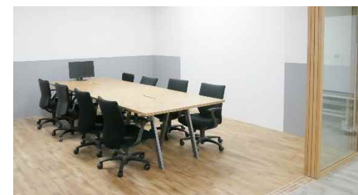
会員専用ミーティングスペース