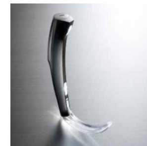
本施設でデザインされた 喉頭鏡