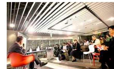
「ナレッジサロン」でのイベントの様子