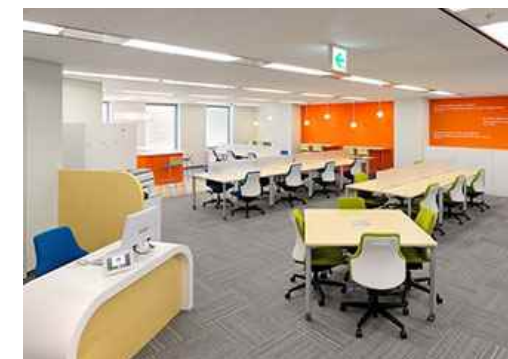
コワーキングスペース