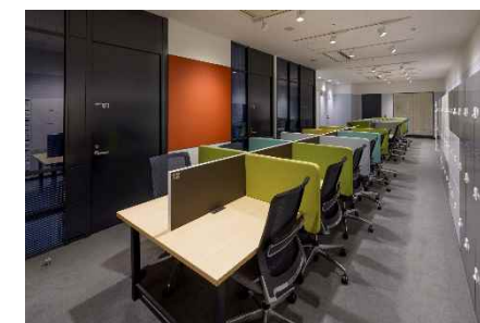
オフィススペース