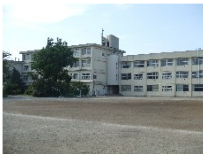
(旧三崎中学校校舎)