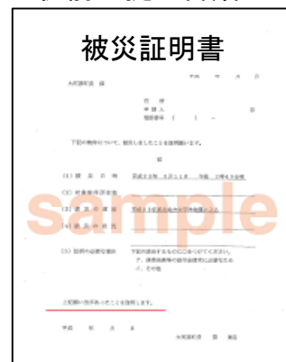
(被災時の住所確認)