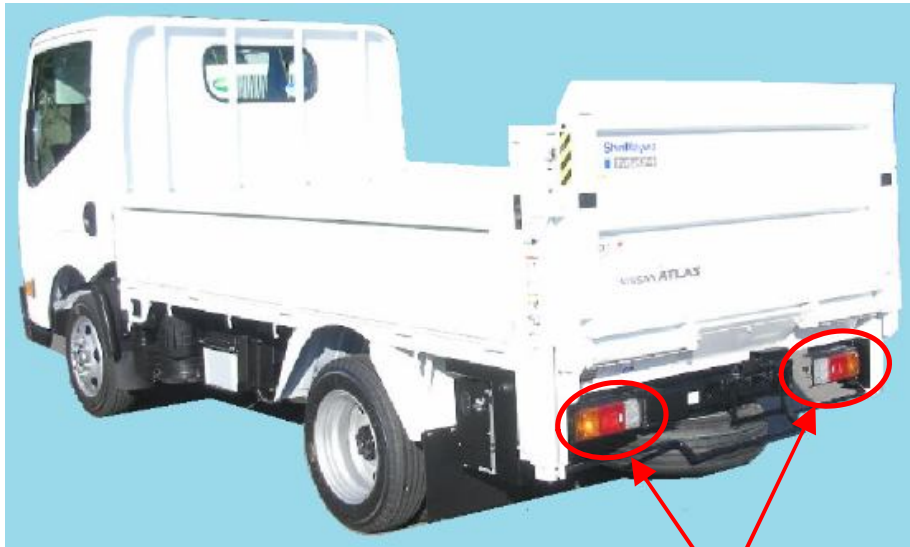
リヤコンビネーションランプ