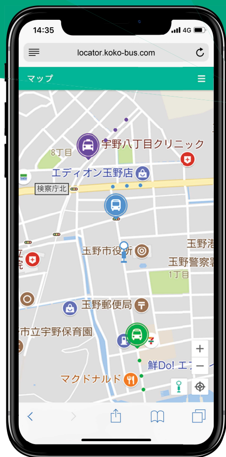
※画面はイメージです。

事業受託：コガソフトウェア株式会社 ( https://www.kogasoftware.com/ ) 孝行デマンドバス Locator