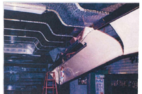
阪神淡路大震災時で被害を受けた三宮地下街の天井崩落