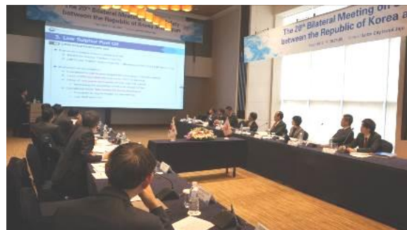
第 20 回「日韓検査課長会議」の様子