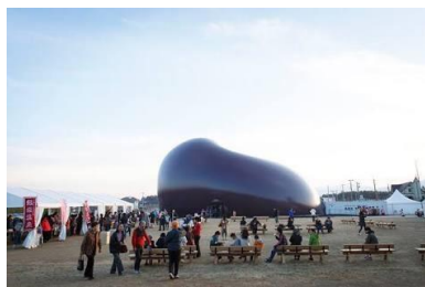
福島県での設置の様子