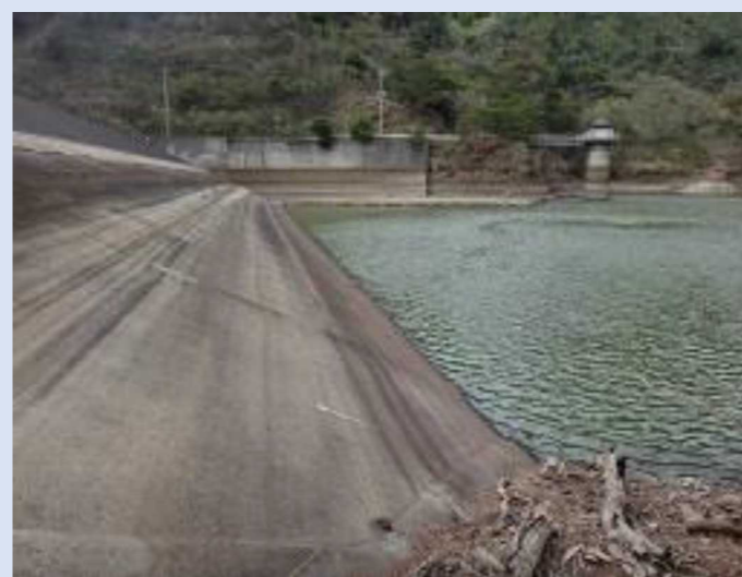
時雨ダム (4月17日の渇水の状況)