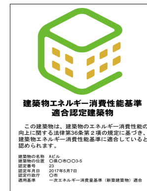
【基準適合認定マーク実績 (H29.8末時点)】