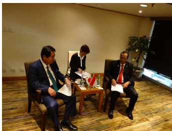
【インドネシアとのバイ会談】