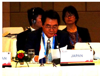
【大臣セッションでの発言】