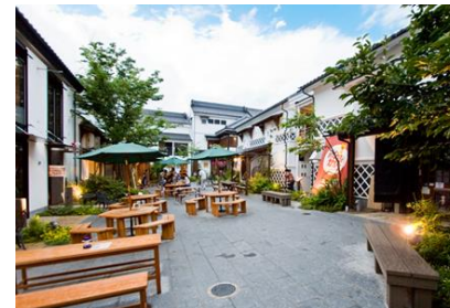
ばていお大門（長野市）

ストック活用を図りながら公共的な空間（広場）を地権者及び民間事業者が共同して整備から管理まで行っている事例