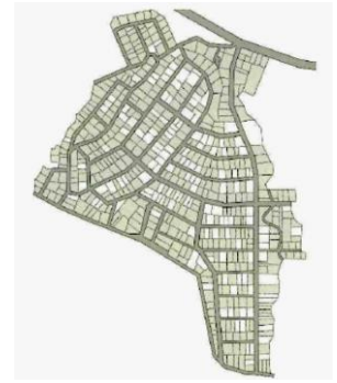
戸建住宅団地の空き地の例*（グレー部）