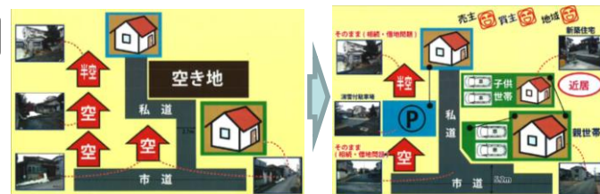
* 山形県鶴岡市「ランドバンク事業」