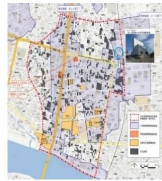
地方都市の商業地の空き地の例（黒塗部）