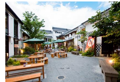
ばていお大門（長野市）

ストック活用を図りながら公共的な空間（広場）を地権者及び民間事業者が共同して整備から管理まで行っている事例