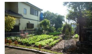
空き地の家庭菜園化が進む郊外の住宅団地