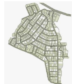
戸建住宅団地の空き地の例*(グレー部)