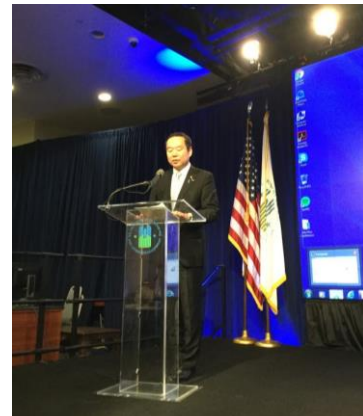
報告会での藤井政務官の挨拶