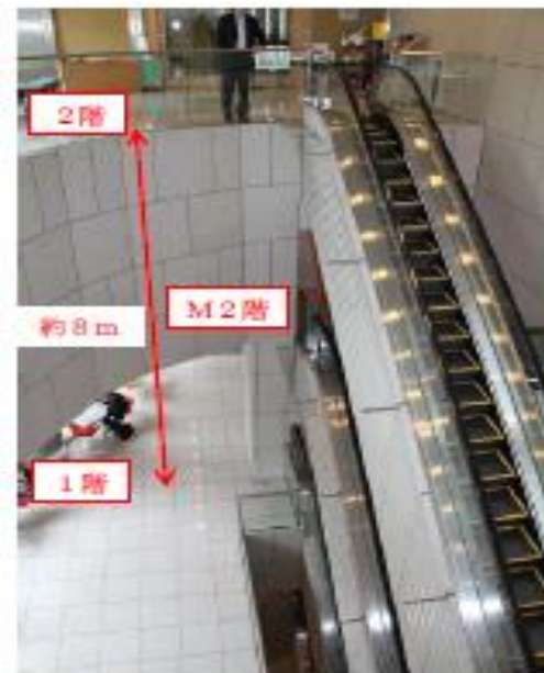
写真1. 事故が発生した吹抜け部分

○ 「本事故は、 エスカレーター自体の不具合や乗場周辺の安全対策の欠如に起因するものではなかった 」との結論。