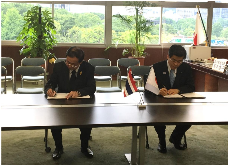
覚書署名時の様子（左：アーコム運輸大臣、右：石井国土交通大臣）