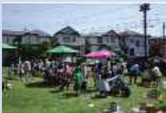
NPO法人等の民間主体により空き地を活用して整備された緑地空間

都市公園内にカフェ等の収益施設を設置する民間事業者を公募し、選定された民間事業者が、設置管理許可の延伸や建ぺい率の緩和を受けて、収益施設と周辺の広場等を一体的に整備する制度を創設する。