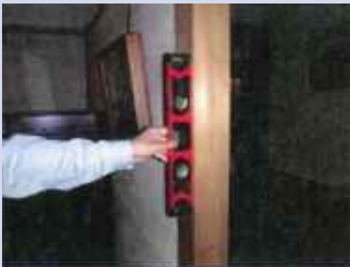
水平器による柱の傾きの計測