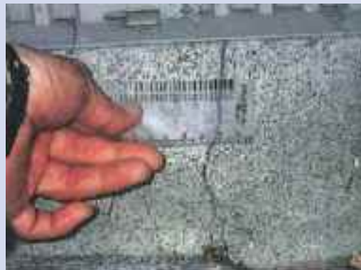
クラックスケールによる基礎のひび割れ幅の計測