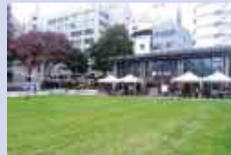
芝生空間とカフェテラスが一体的に整備された公園