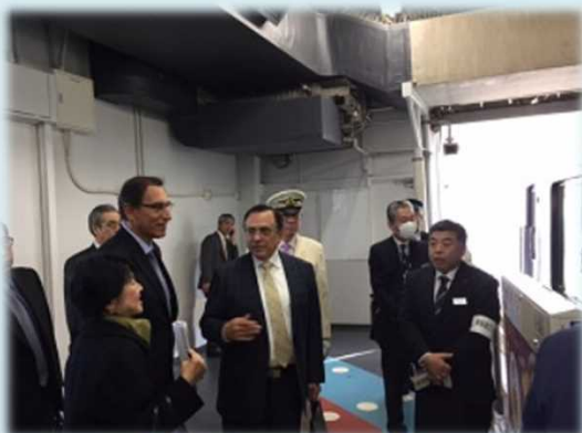
東京モノレール試乗

○ペルー国 平成29年2月14日(火) ビスカラ副大統領兼運輸通信大臣が東京モノレール、ゆりかもめ試乗