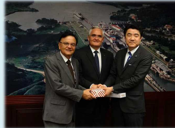
左からロイ運河担当大臣兼メトロ庁長官、キハーノ運河庁長官、野上副大臣

○2016年1月、「パナマ市における質の高いインフラの導入に関する協力覚書」署名