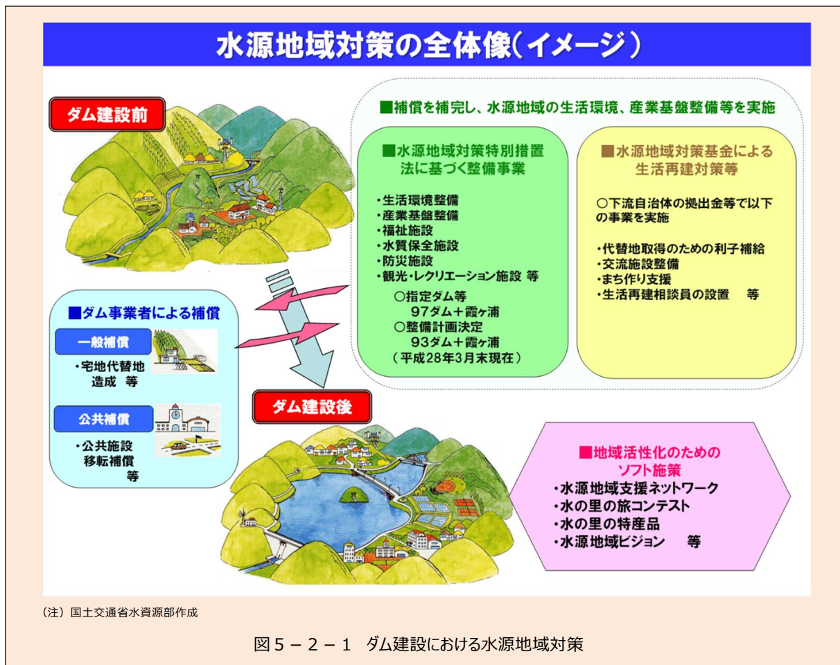
図5-2-1 ダム建設における水源地域対策

水源地域対策には、①ダム事業者による補償、②水源地域対策特別措置法に基づく措置、③水源地域対策基金による生活再建対策等、④水源地域活性化のためのソフト施策(第7章3)の4つの柱があり、相互に補完し合い、総合的な対策が講じられている(図5-2-1)。