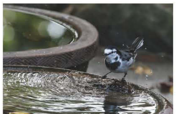
写真:第31回水とのふれあいフォトコンテスト(平成28年度)入賞作品