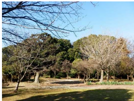
境木本町特別緑地保全地区

同地区は、宅地化が進んだ市街化区域に残された貴重な樹林地として、愛護会によって日常の維持管理がされてきており、平成 27 年度に「横浜市森づくりガイドライン」に基づく保全管理計画が策定され、計画的な樹林地管理による貴重な植物種の増加や環境学習に必要な施設整備等が進めることができました。