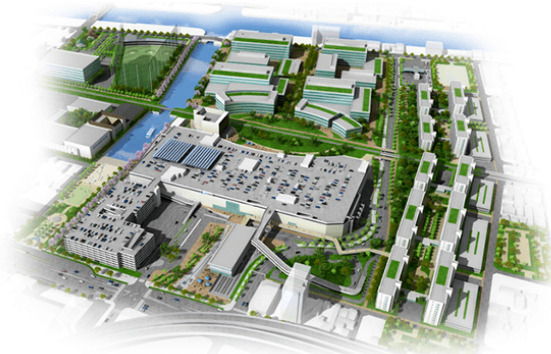
港明地区（みなとアクルス）の整備イメージ

同地区では、 都市緑地法第 39 条（地区計画等緑化率条例制度）に基づく「名古屋市地区計画等の区域内における建築物の制限に関する条例」において、建築物における緑化率の最低限度（20%）が定められており（地区全体では 25% を目標として別途設定）、建築物周辺の緑化が積極的に推進されています。 また、既存の公園と運河を結ぶ緑道や区域外周に配する緑地を主要な公共施設として位置づけ、豊かな緑や水辺空間といった良好な環境を活かした、ゆとりと潤いのある市街地の形成を図ることを目指しています。