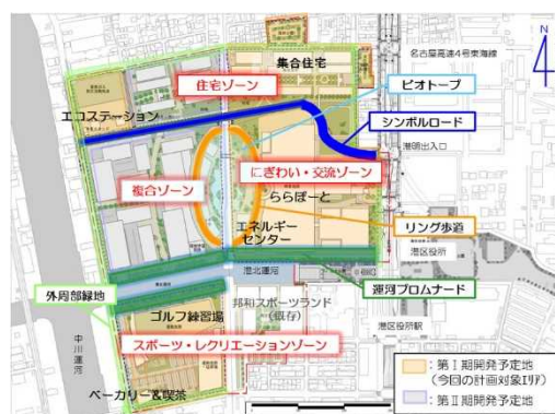
みなとアクルス開発計画図