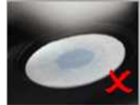
フィルタ 防水性 NG (水が浸透している)