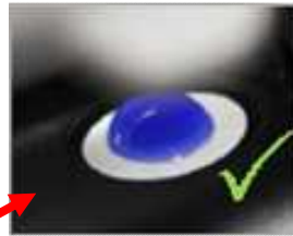
フィルタ 防水性 OK (水を弾いている)