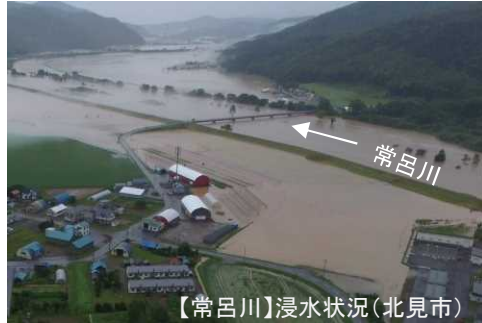
【常呂川】浸水状況（北見市）