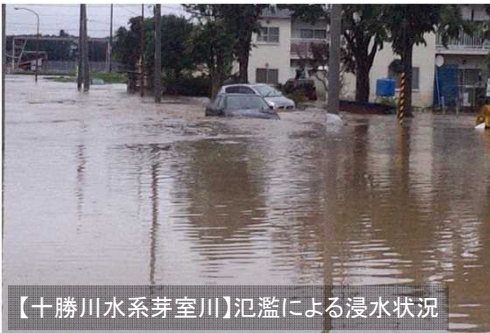
【十勝川水系芽室川】氾濫による浸水状況