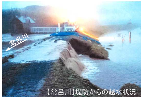
【常呂川】堤防からの越水状況