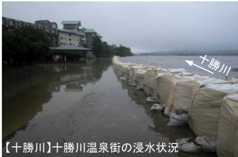
【十勝川】十勝川温泉街の浸水状況

決壊した堤防などの復旧と合わせ、下流部の河川改修を緊急的・集中的に実施することにより再度災害を防止し、地域全体の安全・安心を早期に確保する。