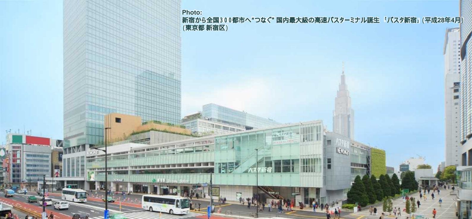
Photo: 新宿から全国300都市へ“つなぐ”国内最大級の高速バスターミナル誕生「バスタ新宿」(平成28年4月) (東京都新宿区)