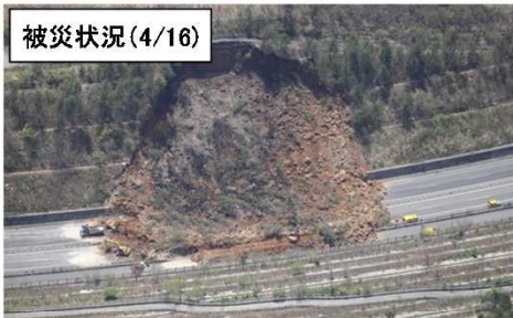
ゆふだけ 由布岳PA付近 土砂崩落