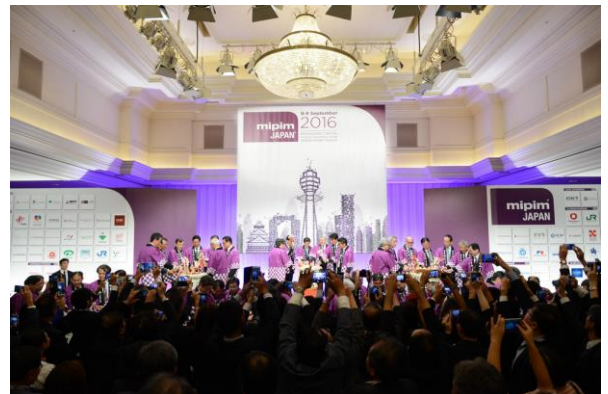
オープニング・カクテルパーティー