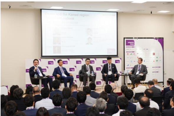
有力経済人らによるカンファレンス