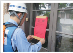
応急危険度判定結果の貼り出し

※このほか、分類未確定住家被害2,520棟 (消防庁災害対策本部：6/30 16:30現在、 熊本県より報告)