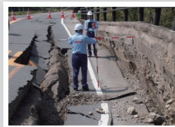
被災状況調査 (国道57号)