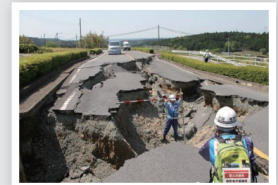
県道陥没調査状況(南阿蘇村)

通行止め24区間 （熊本県 19区間、熊本市 2区間、大分県 1区間、宮崎県 2区間：全て迂回路あり）