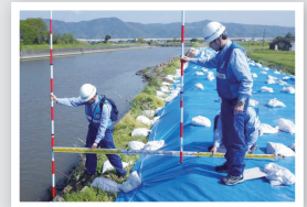
応急復旧箇所の調査