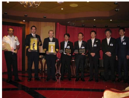
博多港歓迎セレモニー