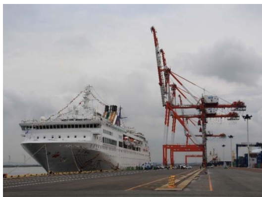
北九州港(ひびきコンテナターミナル)寄港風景

・6/30、「チャイニーズタイشان(総トン数24,427t、乗客定員836人)」が北九州港初寄港。