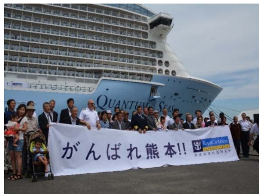
一般見学者と記念撮影