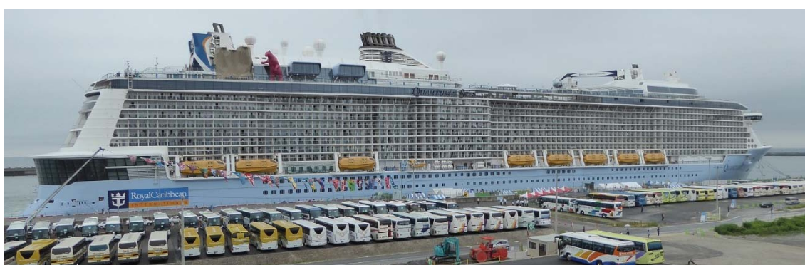
「クアンタム・オブ・ザ・シーズ」高知港寄港の様子

・「クアンタム・オブ・ザ・シーズ(総トン数 168,666t、乗客定員 4,180 人)」が日本周遊クルーズを実施。室蘭港(6/24 初)、横浜港(6/26 2 回目)名古屋港(6/27 初)、大阪港(6/28 初)、高知港(6/29 初)等に寄港。