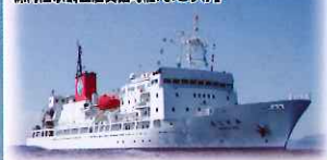
現海警水質調査船支障母船「よこすか」