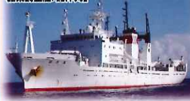
漁業調査船「開洋丸」