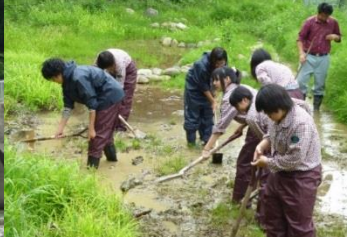
八日市南高等学校(滋賀県東近江市)