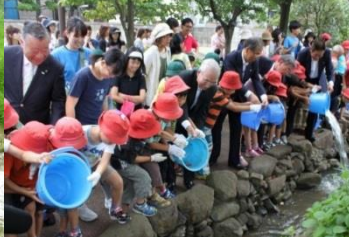
葛西親水四季の道(東京都江戸川区)