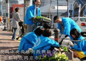
長岡中央商店街振興組合 (京都府長岡京市)