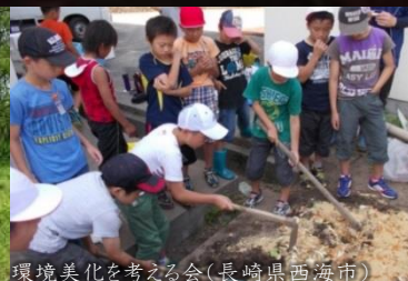
環境美化を考える会(長崎県西海市)