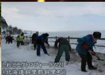
しれとこウトロフォーラム21 (北海道斜里郡斜里町)