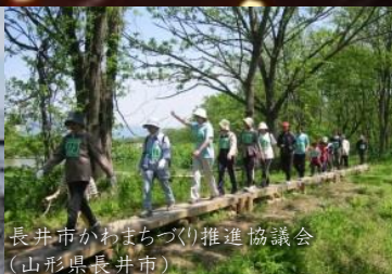
長井市かわまちづくり推進協議会 (山形県長井市)