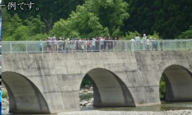
癒しの溪流・里まちなみ(秋田県仙北市)