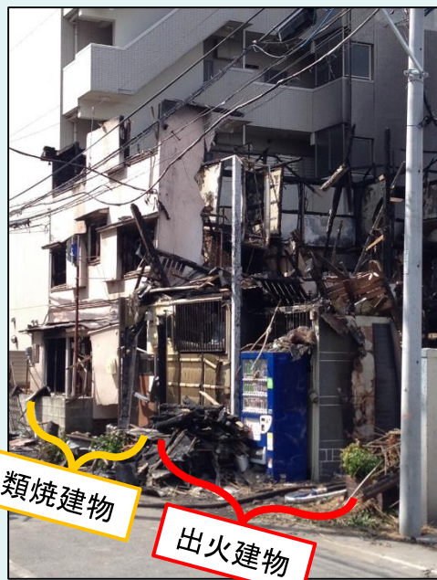
火災後の現場写真