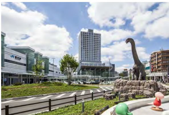
西口交通広場の北エリア方面は、みどりのネットワークの始点として、歴史・環境軸へつながる空間を演出。