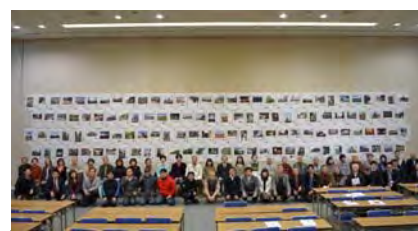
H27年度、百景候補を一般の方向けに披露する「岡崎百景候補お披露目会」を実施、H28年度に市民投票を経て岡崎百景を決定し、公表。

実施にあたっては、岡崎市、景観整備機構である「特定非営利活動法人 岡崎まち育てセンター・りた」、市民公募で集まった「百景推薦人」の3者が協働し、日常の中で見過ごされがちな身近な景観も対象とするとともに、景観を単なる「眺め」として捉えるのではなく「人がその景観に抱く想い(人とまちのドラマ)」に焦点を当てて、その想いにより他者の共感の輪を広げていこうとする事、及び、景観まちづくりの担い手を育てていくプロセスを重視して進めた。選定後は、岡崎百景を景観資産と捉えて守り育てて行く体制に繋げ、その地域らしい景観の創出、地域活性化や観光資源とすることも見据え取組を続けている。