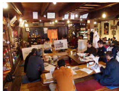
まちの人の交流拠点“いっぷく亭”にて店舗改修時の景観協議会を開催。いっぷく亭の一角には学生が滞在するサテライトラボを設置。

事業当初は点在していた改修店舗が、ある程度連続して面的な効果を持ち、さらに様々な立場の方の意見も加わることで、これまでにない多様性を持つ新たな景観が形作られている。そうした中、大学はかつての商店街の街並みを再生するのではなく、ガイドラインに沿いながらも、各々の店舗がより特色ある個性を発揮し、商店街全体が元気になるようなデザインを提案している。学生は様々な評価を受けることができるという、座学では決して得られない設計者育成にはまたとないデザイン教育の機会となっている。