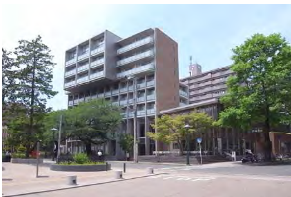
片平北門会館と北門周辺。市道を挟んでオープンスペースと福利厚生施設を整備し、にぎわいを演出。市道は、歩道を拡幅。緑地の縁石部分をベンチ上にして人々が憩える空間を整備。