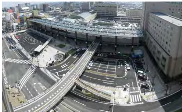
当地区は JR 長野駅の西側に位置。新たに ES と EV を設置、バスロータリーを囲む形でシェルターを設置する等、バリアフリーに配慮した歩行者空間を確保。

都市景観大賞は応募要領でその対象を「公共空間とその周りの宅地・建物が一体となって良質で優れた都市景観が形成され」としている。この地区の対象空間は駅前広場と隣接する駅ビルというシンプルなものであり、他の3面は特別な対応はないから、駅前広場と周辺全体で見ると、これが受賞地区か、という印象を持つ人がいるかもしれない。しかしながら、この駅前広場と駅ビルを一体で考え、つくった、ということがこの受賞の意味である。駅ビルの屋根を広場側に一体的に張り出して、庇のある公共空間をつくった。簡単そうに見えるが実現には様々な制約があったはずであるが、その実現の効果は大きい。庇を支える柱と駅ビルの外壁、また内部の公開された空間等について地場の間伐材を用いることで、自然感を出すとともに善光寺のある街としての落ち着きを獲得している。広場内のシェルター類などの気負いないデザインは好感が持てるし、重要なバスバースをさりげなく目立たせるなど、デザインの手法は洗練されている。床材となる石材は、共通の材料を広場部分と通路部分でサイズを変えるに止まり、これは善光寺表参道(中央通り)の舗装材と揃っているという。広場(施設)を単体でとらえず、隣接建物(駅ビル)と一体にすることで獲得された機能、そして過度に「デザイン」に走らない手法など、アーバンデザインの良例と言えるだろう。(高見)