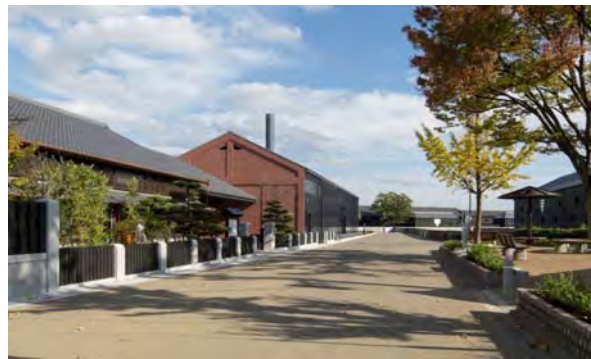
MIZKAN MUSEUM南側の風景：右手前は再整備した中村街園。ミュージアムのオープンに合わせて、道路舗装、街園の整備を実施。