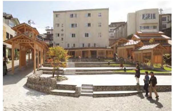
浴衣姿で温泉街の風情を肌で感じていただくための施設として、木回廊と石畳を敷いた棚田風の多目的広場「湯路広場」が新たに誕生。