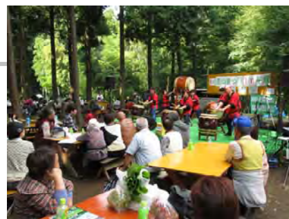
第4回里山まつりで地元食材や音楽を楽しむながら市民交流する参加者(ベースキャンプ)

こうした現状の改善を目指して豊かな里地里山が広がる白井市北郊の「平塚地区」を中心とした地域で、「里山を活かしたまちづくり」をスローガンに里山の自然や耕作困難な農地などの再生・保全事業を軸に、地域の景観づくりや多様な生き物の復活、子どもの環境教育、都市部住民と地元との交流活動などにも取り組んでいる。NPO法人しろい環境塾は、こうした幅広い活動を通じて「里地里山全体の景観向上」に貢献しており、その成果が年々広がりを見せている。現在は田畑や樹林地、道路沿いな管理面積が約13haに拡大、「田んぼの学校」や各種生きもの調査・観察会、地域の伝統文化を体験する「ぐるっと一周平塚の里」や地域交流の「里山まつり」などは、人気が高まり定着しつつある。