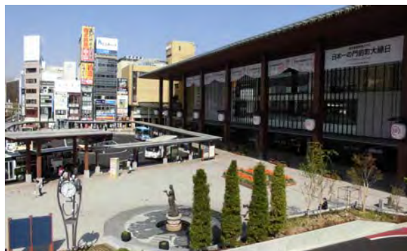
歩行者専用デッキから大庇・列柱を望む。「善光寺のような歴史性、伝統性、仏閣にあるゲート性」や、「自然風景のようなスケール感」、「樹木に囲まれた木陰の空間」をモチーフとした。