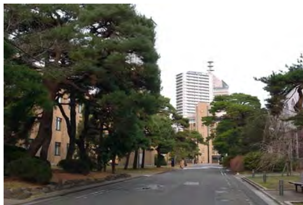
青葉城を向く正門からの軸線。建物の一部を塔状に立ちあげ、アイストップとなるデザインとしている。また、旧制第二高等学校時代から続く赤松の並木を生かした景観を維持している。