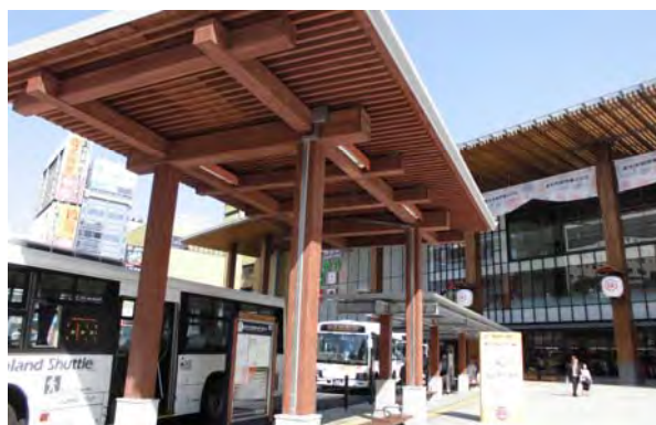
門前回廊とバスロータリーを囲むシェルター。木を身近に感じてもらうため、市産木材を使用。大庇はガラス屋根の下に木製ルーバーを設置、列柱は鉄骨造の構造躯体の周りに木製の化粧部材を貼付。