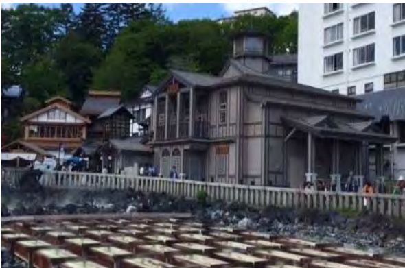
草津温泉の伝統文化「湯もみ」を伝承する施設「熱乃湯」。建築物の高さや屋根形状、壁の仕様、看板類の大きさなどを景観ガイドラインに盛り込み、街なみが後世へ引き継げる工夫がされている。