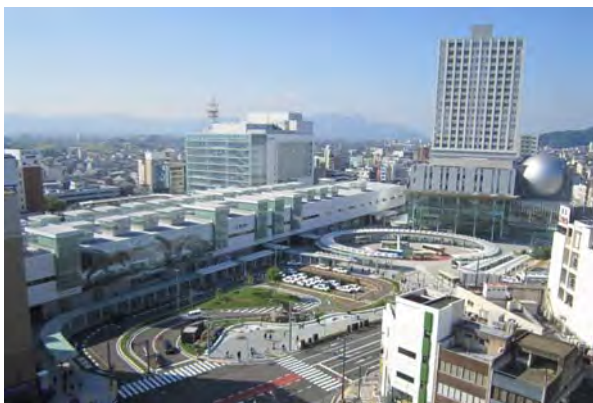
JR 福井駅西口全景。各方面からの都市の軸が集まってくる場所であるため、それらを結節させる役割を担っている。交通結節点として既存の路面電車を延伸。

福井駅西口地区では、北陸新幹線の延伸に向けて質の高い環境整備が一体的に成されている。当地区は、市内へとつながる都市軸の起点として、歩行者・バス・タクシー・路面電車等の各交通手段が機能的に整備され、福井市の新たな顔を形作った。特に、北陸の気候風土に配慮した屋根付き広場は、再開発ビルと一体化しつつ東西の都市軸を繋いでいる点が高く評価される。明るく開放的なこの場は、市民活動の核となることだろう。また、意見の異なる数多くの地権者の意向を根気強く調整し、商業施設を一括運営する再開発ビルへとまとめ上げた関係者の努力に、深い敬意を表したい。なお、恐竜像の設置に関しては、意見の分かれるところであるが、学術的裏付けを持って造られたことは好感が持てる。今後は、新幹線口となる東口整備が進行していくこととなるが、駅空間全体としてのコーディネートも必要となるだろう。更なる整備の深化を期待したい。(田中)