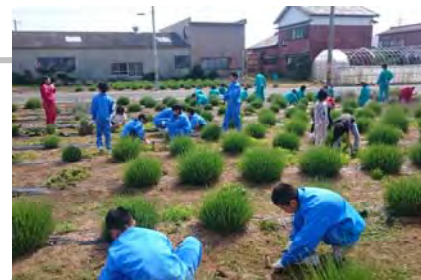
「ラベンダープロジェクト」ドリームの会で草取りや花の摘み取り作業を実施。花の摘み取り作業は全校生徒が参加。

平成15年度に、ボランティアクラブ「ドリームの会」を結成し、地域の美しい景観を守るため、海岸などの景観美化活動が始まった。以来、景観まちづくりへの取組は、全校生徒による景観を美しくする奉仕活動の「サンキュー☆福江」や、地域の活性化を担う「福江*つるし飾りロード」、ラベンダーの栽培から商品開発、活動PRを兼ねた販売まで実施する「ラベンダープロジェクト」、総合的な学習の時間など、様々な活動が継続、展開している。行政機関および地域の方々と連携して、地域の景観まちづくり活動に取組み、地域活性化の一翼を担っている。