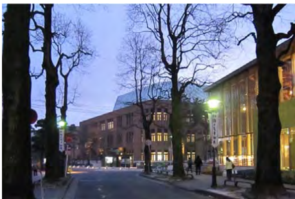
中心市街地の一番町通りの突き当たりの北門周辺。塀も門扉もないポケットパーク状のオープンスペースとカフェテリアなどが一体となって開かれたエントランス空間となっている。