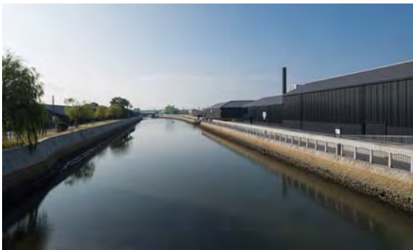
運河右岸の新築したMIZKAN MUSEUM(手前)と中間実験棟(奥)：「伝統」+「革新」と位置づけ、中間実験棟は、従前同様に改築、MIZKAN MUSEUMは景観継承しながら近景として現代的な雰囲気を表現。

景観継承がキーワードである。保全、活用、創造を当然のように内包し、時代の変化のなかで、場所としての雰囲気、記憶をつないでいく。そのために、プロポーションと質感を継承しつつサイズと素材を革新し、製造停止といった生産の変化をミュージアムやイベントといった意味に転換した。この企画の戦略性と具体のデザインの質の高さに感服する。地域に根ざした老舗企業のプライドと責任感がなせる仕事である。また半六邸の保存は地域住民の粘り強い活動成果である。耐震補強の方法までを提案して無理といわれた保存を勝ち取った。さらに運営費を稼ぎ出しての活用は、老舗から新たな主体への資源の譲渡、これも継承である。こうした民による質の高い仕事に対して自治体は、計画とインフラの高質化によって景観の担保と下支えを行った。条例に基づく修景補助は主な施設の間にある住宅や店舗の外観の雰囲気を方向づけている。こうしたコラボレーションが、運河沿いの景観を変化させながらもつないでいる。ここで撮影された黒澤明「姿三四郎」の映画のシーンを継承する何かも期待できそうだ。そのためにもこの場所の芯である運河の水が元気であり続けて欲しい。(佐々木)