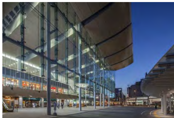
福井駅、西口交通広場、屋根付き広場と民有地が一体的に計画され、利用者にとっては境界の無い連続した空間を創出。広場と施設が一体となって市民や観光客を誘導。