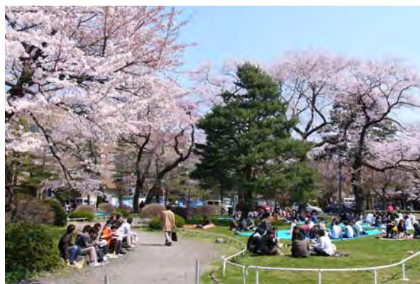
春の学都記念公園。学生、教職員のみならず近隣の住民や市民のお花見や憩いの場として親しまれている。