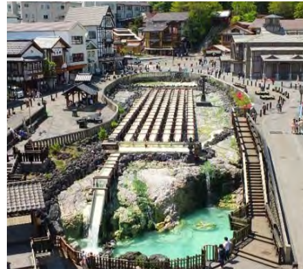
温泉街特有のすり鉢状の地形の中心に「湯畑」が存在し、湯けむりの中にこんこんとわき出る温泉が湯樋を通り滝となって流れ落ちる風景は、唯一無二の温泉情緒を醸し出している。