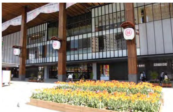
庇は吊構造とし、視覚的に邪魔になる部材を排除。このため雨に濡れずに光を取り込むことが可能で、見上げた時の爽快感を演出。プランターによる植栽は、季節やイベントに合わせて設置。