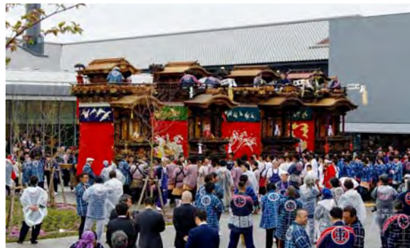
地元の祭礼行事の風景：MIZKAN MUSEUMの中庭に山車を曳き込むなど地域の祭りに参画。運河沿いの整備に伴い、様々なまちづくり団体によるイベントの開催が増加。