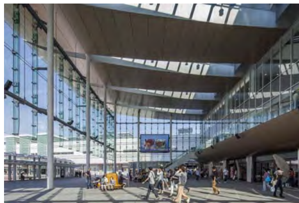
屋根付き広場付近は「おもてなし・にぎわいゾーン」と位置づけ、歩行者のメイン動線空間としてにぎわい軸を形成。人を引き入れる空間として、大庇とガラスで囲まれた大空間を創出。