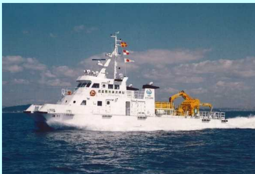
調査観測兼清掃船 海輝（かいき）