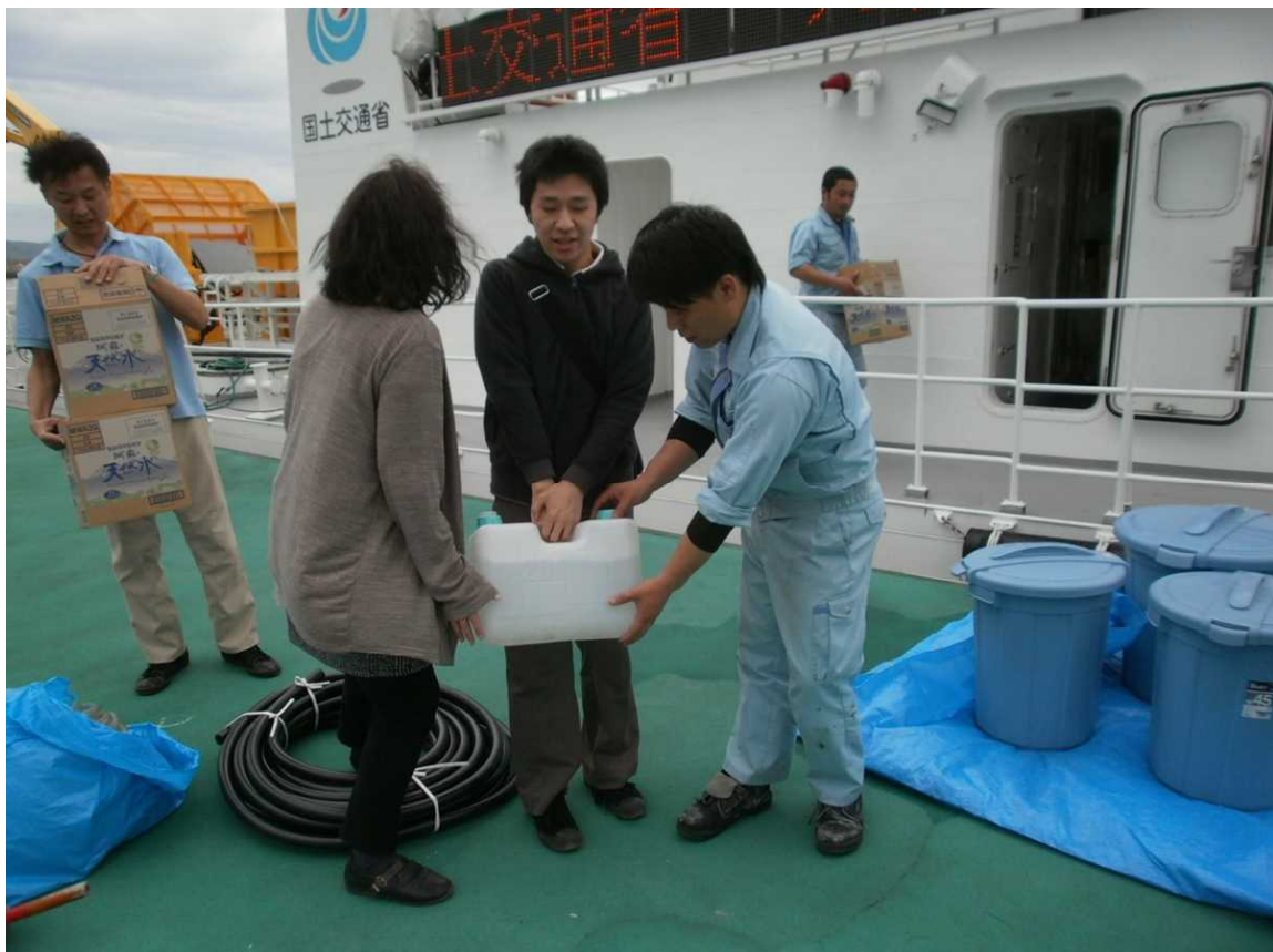
船上での給水の様子