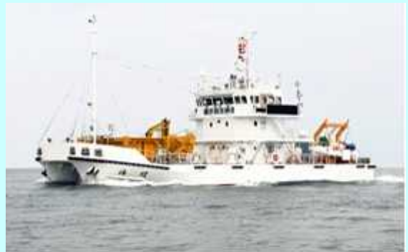
調査観測兼清掃船 海煌（かいこう）