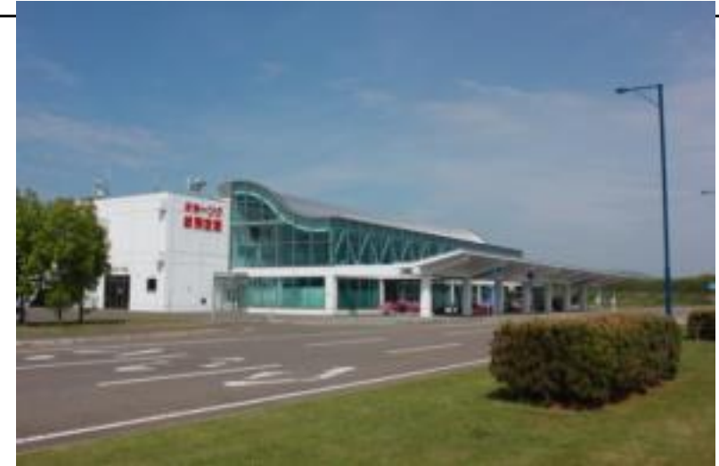
オホーツク紋別空港