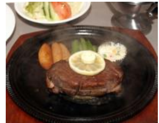
オホーツクはまなす牛