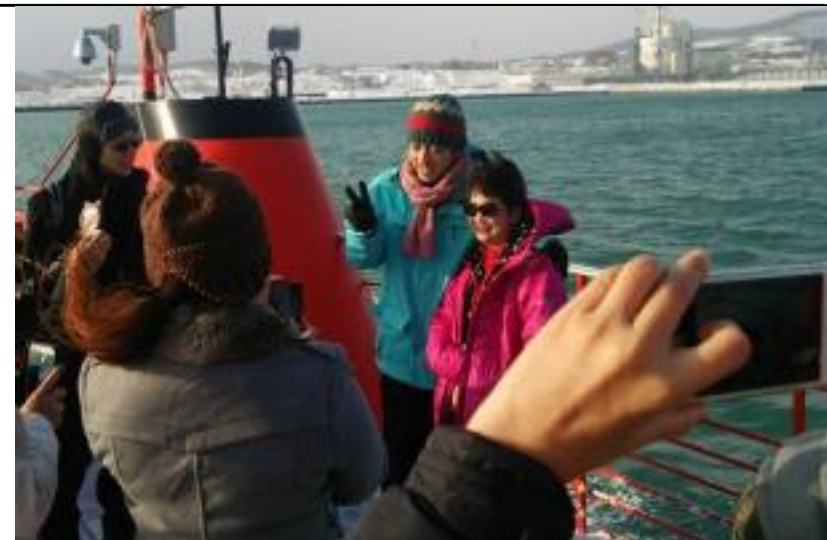
タイテレビ番組収録とタイ人観光客

・各国に対するPRについては、旅行会社店舗内広告・他の団体との協同による旅行博等の参加やメディアの招聘等、連携を図り、負担軽減を図る。