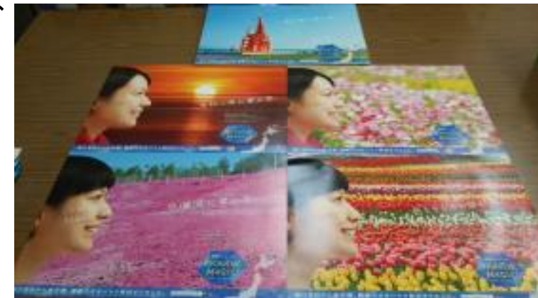
各市町村のシンボルとタイアップしたイメージポスター