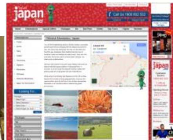
オーストラリアの旅行会社HPの紋別紹介ページ