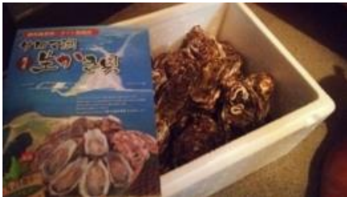
サロマ湖産カキ貝