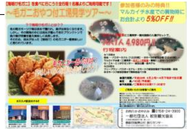
市内周遊バス広告