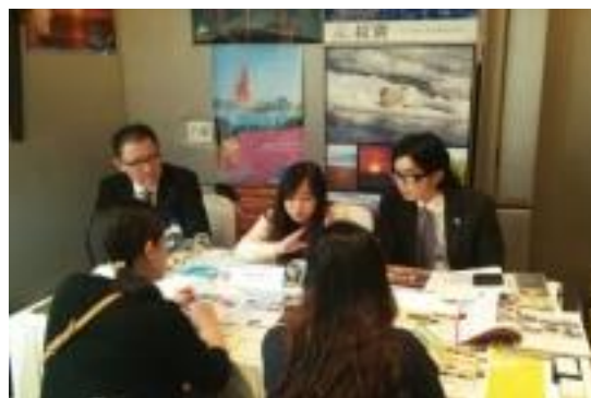
タイでの商談会の様子