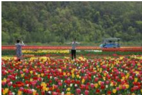
かみゆうべつチューリップ公園