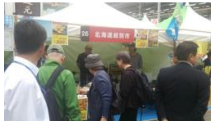
東京都内の物産展