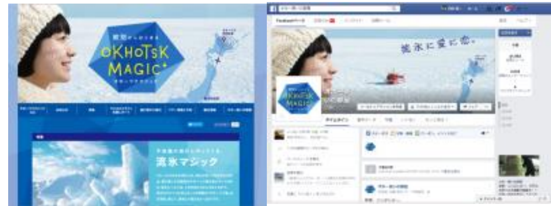
オホーツクマジックキャンペーンHP とフェイスブック