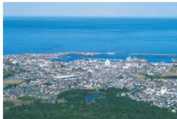
大山山頂から紋別市街・オホーツク海を臨む