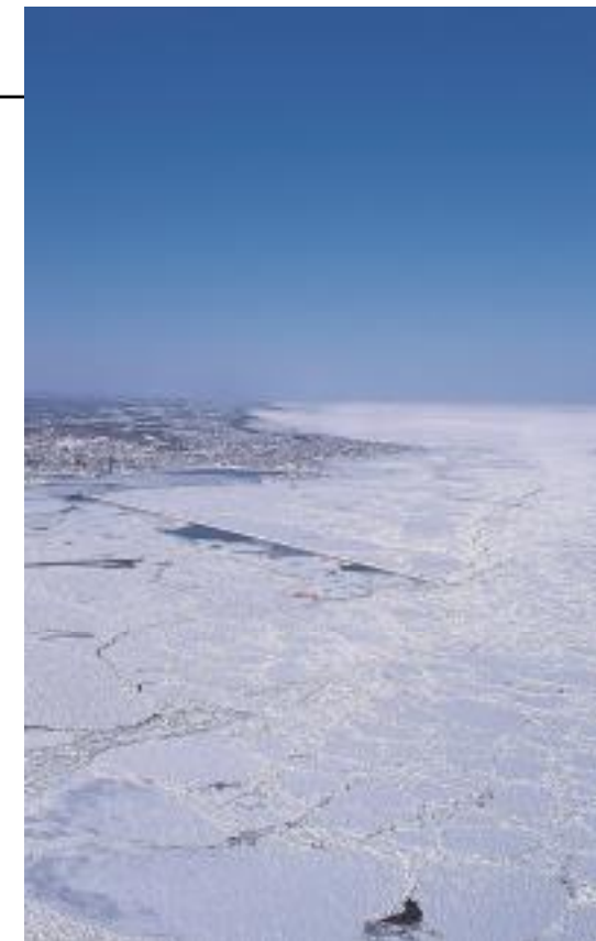
流氷原を進むガリンコ号Ⅱ