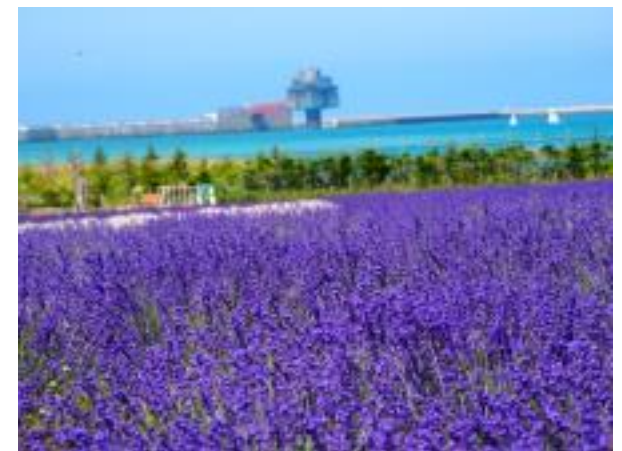
ラベンダー畑とオホーツク海(紋別)