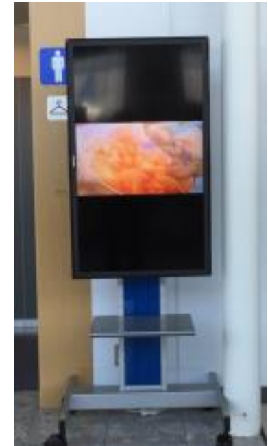
デジタルサイネージ