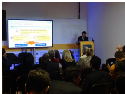
カンファレンスでのプレゼンテーション