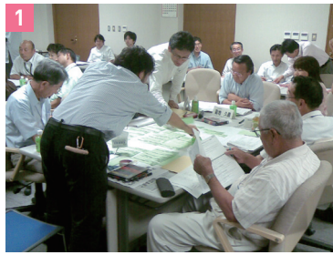
1 集団移転が決定した際の宮城県岩沼市玉浦西地区の住民たち。どんなまちにしたいか地元関係機関を交えたワークショップを開催。議論を重ねたまちには隅々まで住民の思いが込められている。