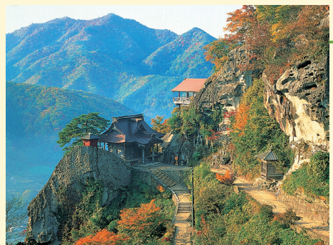
「紅葉の宝珠山 立石寺(山寺)」