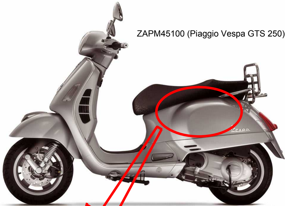
ZAPM45100 (Piaggio Vespa GTS 250)