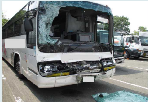
貸切バスの損傷状況

平成26年8月25日、貸切バスが乗客29名を乗せて走行中、大型トラックに追突した。この事故により、貸切バスの運転者と交替運転者が重傷を負い、乗客24名及び相手車両の運転者1名が軽傷を負った。なお、貸切バスの運転者は、事故発生24時間以上経過後に死亡した。