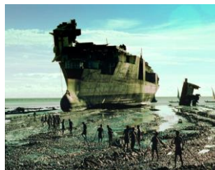
開発途上国におけるリサイクルヤードの現場